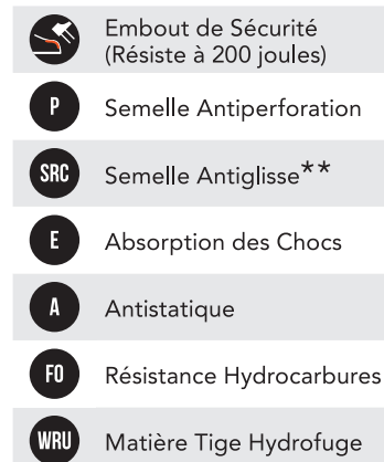
TABLEAU NIVEAU DE SÉCURITÉ